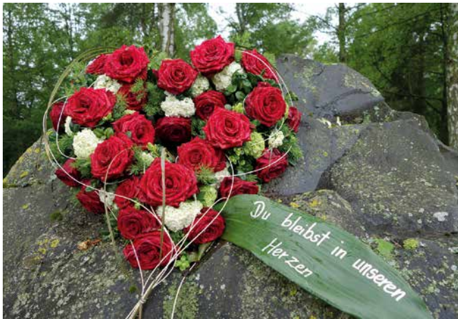
Gedenken Blumenherz.

Früher waren Krankheit, Sterben und Tod in der Großfamilie unter einem Dach vereint, genauso wie Romanze, Heirat und Geburt. Heute haben viele Menschen nie lernen und auch nie erfahren können, was Sterben und Tod bedeuten und wie sie von einem geliebten Menschen Abschied nehmen und richtig trauern können. Hinzu kommt, dass viele Angehörige nicht oder nicht mehr an dem Ort arbeiten, an dem sich das Grab befindet. In letzter Zeit kommt Corona mit den Kontaktbeschränkungen hinzu.