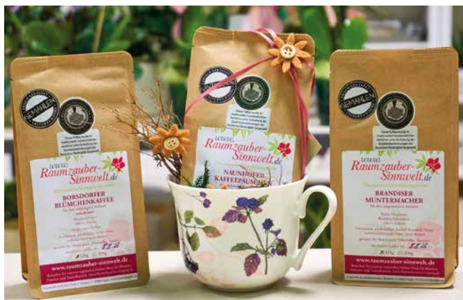
Kaffeespezialitäten aus Ihrer Raumzauber-Sinnwelt

Begeistert nicht nur Kaffee-Sachsen: Kaffeespezialitäten aus Ihrem Heimatort