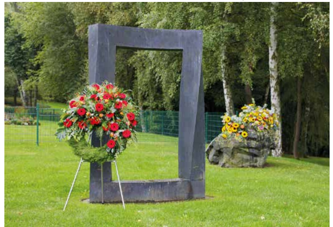
Tor zwischen den Welten.