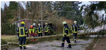
Im Februar mussten die Kameraden zur Beseitigung mehrerer Sturmschäden ausrücken.

Der vergangene Monat gestaltete sich für uns sehr ereignisreich – nicht nur wegen der Stürme. Wir wurden insgesamt zu 17 Einsätzen gerufen. Den Beginn machte am 5. Februar ein Brandmeldereinlauf in der Macherner Sporthalle Tresenwald, wo unsere Drehleiter gemäß Alarmierungsplan ausrückte. Nur vier Tage später rückten wir zu einem Mülltonnenbrand in die Nordstraße aus. Der Sturm „bescherte“ uns am 17. Februar drei Einsätze, wobei abends noch eine Tragehilfe für den Rettungsdienst hinzu kam. Am 19. Februar hatten wir wiederum vier Einsätze, bei denen es um die Beseitigung von Gefahren durch Sturmschäden ging. Vorrangig mussten dort umsturzgefährdete Bäume abgetragen werden. Am nächsten Tag unterstützten wir die Beuchaer Wehr mit unserer Drehleiter beim Abtragen eines Baumes und die Altenba-