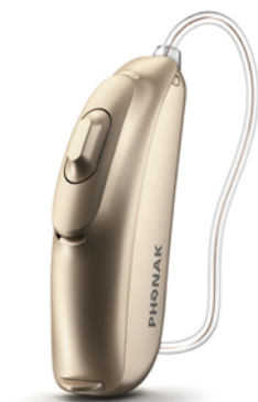
Audeo B 30 10