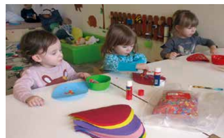
Faschingsvorbereitungen bei den kleinen Springmäusen.

Für viel Aufregung sorgte auch die Vorfreude auf unser alljährliches Faschingsfest. In allen Gruppen liefen die Faschingsvorbereitungen auf Hochtouren. Es wurden Girlanden gebastelt, Luftballons und