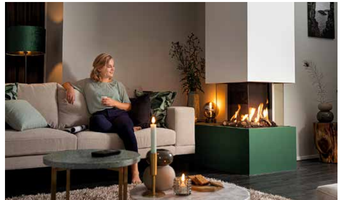
Gaskamine sind ideal für urbanes und modernes Wohnen.

Der Carismo 2050 eröffnet ganz neue, bauliche Perspektiven. Exponiert angebracht an einem Wandvorsprung oder einer Raumpitze tritt der Kamin hervor und dominiert in jeder Hinsicht das Geschehen. Dabei bietet der vierseitig verglaste Gas-Einsatz mit zwei langen und zwei kurzen Seiten einen beeindruckenden Blick auf die Flammen. Durch seine 270-Grad-Rundum-Sicht lässt sich das Tänzeln aus jedem Winkel genießen. So wird aus einer bislang kahlen Ecke der feurige Mittelpunkt, in dem alle Linien optisch verschmelzen. Und die ausgefeilte Technik mit einer Heizleistung 6,8 bis 8,3 kW sorgt stets für angenehme Temperaturen.