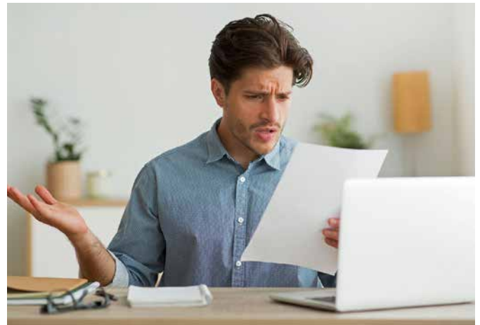
Ein böses Erwachen erleben derzeit viele Stromkunden in Deutschland: Der bisherige Anbieter liefert nicht mehr und man wechselt in die teure Grundversorgung.

„Ein ganz neuer Stromtarif ist in der Regel günstiger als die Ersatzversorgung. Darum sollten Verbraucher, die in die teure Grundversorgung geraten sind, aktiv werden und wechseln“, rät Ralph Kampwirth. Infos gibt es etwa unter www.lichtblick.de/energieanbieter-insolvent . Die Kündigungsfrist beim Grundversorger betrage