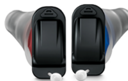
Silk 1 X