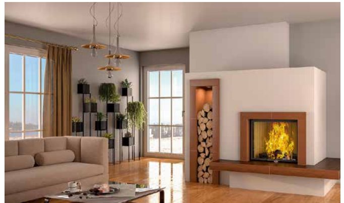
Verbraucher sollten sich in Sachen Wärmeversorgung frei für individuelle, effiziente und umweltfreundliche Lösungen entscheiden dürfen.

Klimaschutz ist in aller Munde, denn die derzeitigen Prognosen der Experten sind dramatisch: Wenn der Treibhausgasausstoß nicht deutlich gesenkt wird, könnte die Durchschnittstemperatur auf der Erde bis zum Jahr 2100 um weitere fünf Grad steigen – mit fatalen Folgen. Nicht nur Staaten sind dabei gefordert, sondern jeder einzelne Haushalt. Vor allem im Gebäudebereich gibt es in Deutschland noch viel Potenzial, CO 2 -Emissionen zu reduzieren und damit auch Kosten einzusparen. Moderner Heizungs- und Ofentechnik unter Einbindung erneuerbarer Energien kommt dabei eine wichtige Rolle zu. Allerdings können immer mehr Bauherren, Haus- und Wohnungsbesitzer aufgrund von Zwangsvorgaben nicht mehr frei über ihre Heizungstechnik und damit auch über die Art des bevorzugten Energieträgers entscheiden, sondern sind an zentrale Fernwärmenetze und -verträge langfristig gebunden.