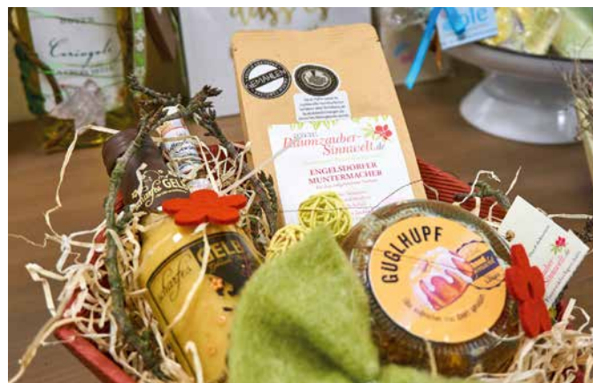
Immer ein tolles Geschenk: Regionale Köstlichkeiten