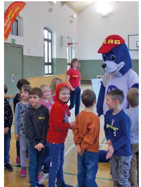
Faschingsvorbereitungen bei den kleinen Springmäusen.