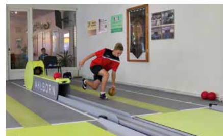
Volle Konzentration beim Abwurf.

Die ersten Deutschen Meisterschaften sowie der erste Vergleichskampf mit den