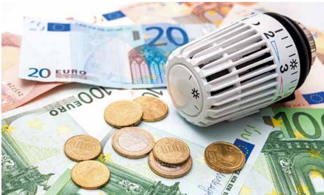
Eine moderne individuelle Wärmeversorgung reduziert die CO 2 -Emissionen und bringt in der Regel Energiespar- wie auch Kostenvorteile mit sich.